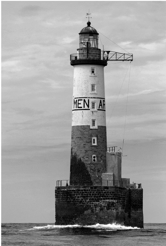
Le mythique phare Ar-Men

(1) Elles résistent aux vents et aux tempêtes. De Dunkerque à Calvi, les phares protègent les côtes françaises. Cent cinquante forteresses des océans se dressent le long du littoral de métropole et d'outre-mer, dont vingt-cinq en pleine mer, alertant les marins des dangers qui les guettent. Chaque phare possède ses singularités, son histoire. Par exemple le mythique phare Ar-Men (« pierre » ou « rocher » en breton), dans le Finistère, est né à la suite du naufrage, en septembre 1859, de la frégate impériale Sané sur les rochers de l'île de Sein, à la pointe ouest de la Bretagne. Pour les autorités, ce fut le drame de trop.